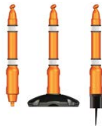
Dwa rodzaje podstaw do słupka.