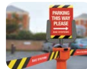
Bardzo łatwy montaż wystarczy ciągnąc nakładkę z jednostki i założyć uchwyt.